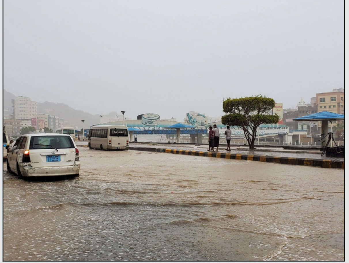
سيارات تمر في شوارع تفيض بالمياه في مدينة المكلا شرق حضرموت