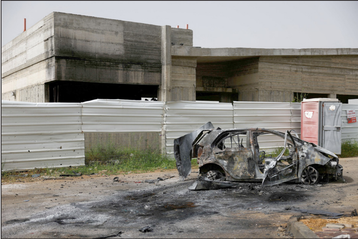
من الدمار الذي سببته غارة «حزب الله» على موقع إسرائيلي في عرب العرامشة

«الخماسية» في الضاحية من دون السفيرين السعودي والأمريكي... وفرنجية إلى مائدة البطريك