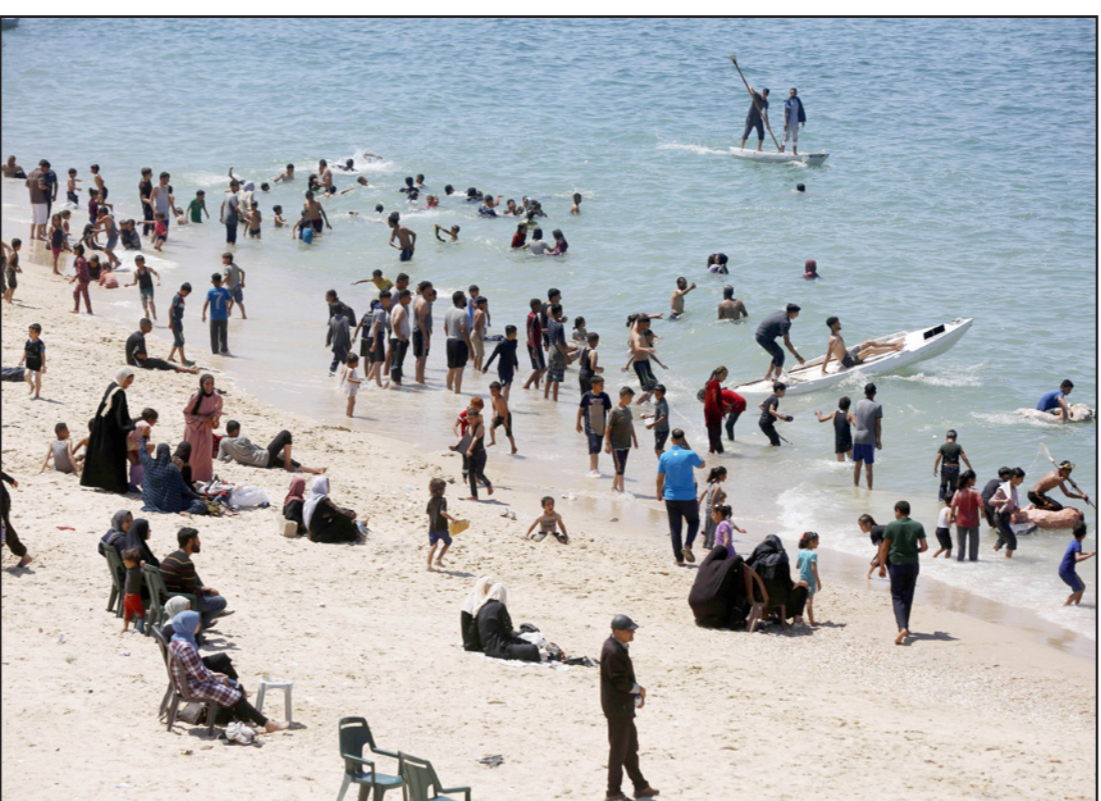
فلسطينيون على شاطئ دير البلح في غزة

ونشر صحافي إسرائيلي في القناة الـ13 الإسرائيلية صورة قارب فيها شاطئ دير البلح وشاطئ زعيم جنوب عسقلان، وعلق على الصورة بالقول «بينما تم إعلان شاطئ زعيم منطقة عسكرية مغلقة، ولا يمكننا نحن السكان الاقتراب منه مندودن مراقبة عسكرية، على الجانب الآخر من السياج، يقضي الغزاويون وقتهم على الشاطئ، ويستحمون في البحر كما لو لم تكن هناك حرب» وعلق أحد الغردين الإسرائيليين على المشهد بالقول أنهم أن سكان غزة عادوا إلى قضاء وقت ممتع على شاطئ دير البلح، وتساءل عما إذا كان سكان عسقلان قد عادوا أيضاً إلى الشاطئ.