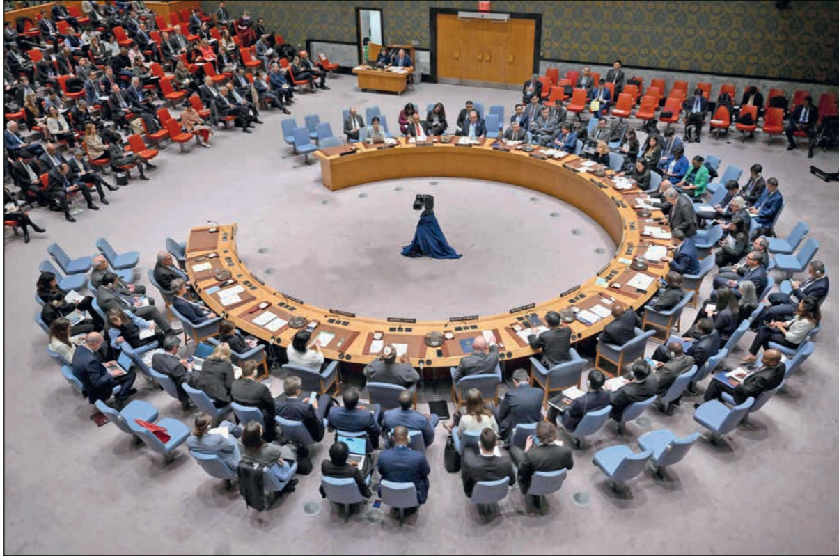
جلسة لمجلس الأمن أمس

وفي وقت سابق أمس الأول الأربعاء، صادقت الحكومة الإسرائيلية على إضافة نحو ألف مكان احتجاز للأسرى الفلسطينيين في مصلحة السجون، بكلفة نحو 450 مليون شيكل (119.21 مليون دولار) تعمل بنسبة 50 في المئة من موازنة وزارة الدفاع، و50 في المئة من باقي الوزارات الأخرى، وفق موقع «السلام» الإخباري العبري.