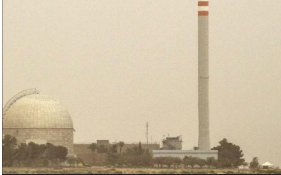
مفاعل ديمونا (أرشيف)

وقالت وكالة الأنباء الإيرانية إن الوزير الإيراني شرح في اللقاء الذي تم في مقر الأمم المتحدة في نيويورك