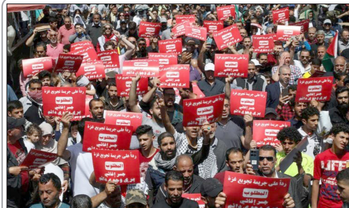
مظاهرة مناصرة لغزة والمقاومة في عمان

في كل حال، أهمية زيارة المجاملة مع اللواء الدوري واتصالات التضامن مع المراقب العام السابق للجماعة الشيخ سالم الفلاحات ومجموعته في قيادة حزب الإنقاذ والشراكة،