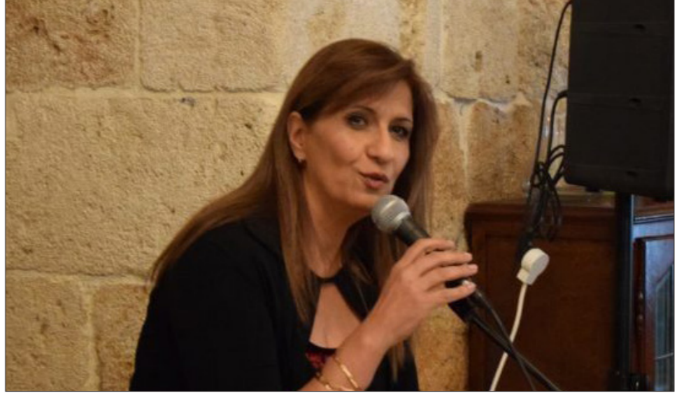
البروفيسور شلهوب - كينفوركيان