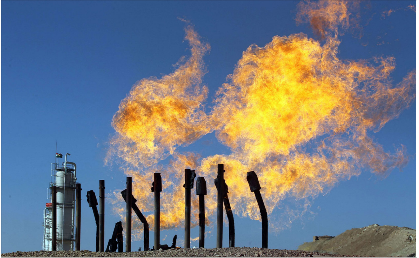
لهب حرق الغاز المساحب في حقل هافانا النخلي قرب مدينة كركوك في شمال العراق

الشركات الأمريكية في العراق، وقال السوداني خلال اجتماعه في واشنطن مع رؤساء وممثلي الشركات الأمريكية إن «حصيلة المباحثات والتفاهات مع الجانب الأمريكي كانت وجوب المضي لتطويع العلاقات الثنائية بمختلف القطاعات الاقتصادية والاجتماعية والأمنية»، بحسب ما ورد في بيان للحكومة العراقية. وأضاف أن العراق «يشهد استقراراً ملحوظاً رغم التحديات في المنطقة، ونعمل على إبعاده عن زور الصراع والتصعيد وقطعنا شوطاً مهماً في الإصلاحات الاقتصادية، وتنفيذ مشاريع كبرى تسهم في حل المشاكل كما قدمنا للبرلمان العراقي قانوناً يعالج التحديات التي تواجه القطاع الخاص». وقال السوداني بحسب وزارة الخزانة الأمريكية، فإن 80% من التحولات العراقية تسير وفق المعايير الدولية، ونعمل على إكمال النسبة المتبقية، كما أنجزنا حساب الخزينة الموحد والنظام المتكامل للمصارف، وتحديث الجباية والإصلاحات الجبركية وإعادة توجيه الدعم باتجاه الصحيح».