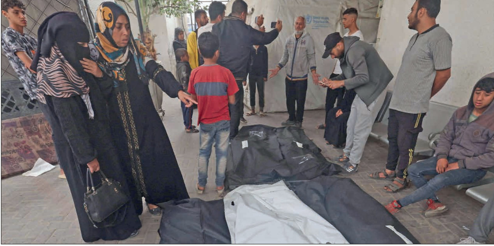
فلسطينيون حول جثامين شهداء سقطوا بالقصف الإسرائيلي على رفح

للأشخاص الذين سيتم إجلاؤهم من رفح في المستقبل. وفي إطار الإخلاء الجزئي، أوضحت القناة أنه سيتم نقل البعض إلى خان يونس والبعض الآخر إلى الساحل، لافتة إلى أنه بعد عملية الإخلاء ستبدأ النازرة التي قد تستمر أسبوعين أو ثلاثة أسابيع، ومن المتوقع أن يأتي ذلك بموجة أخرى من المغادرين.