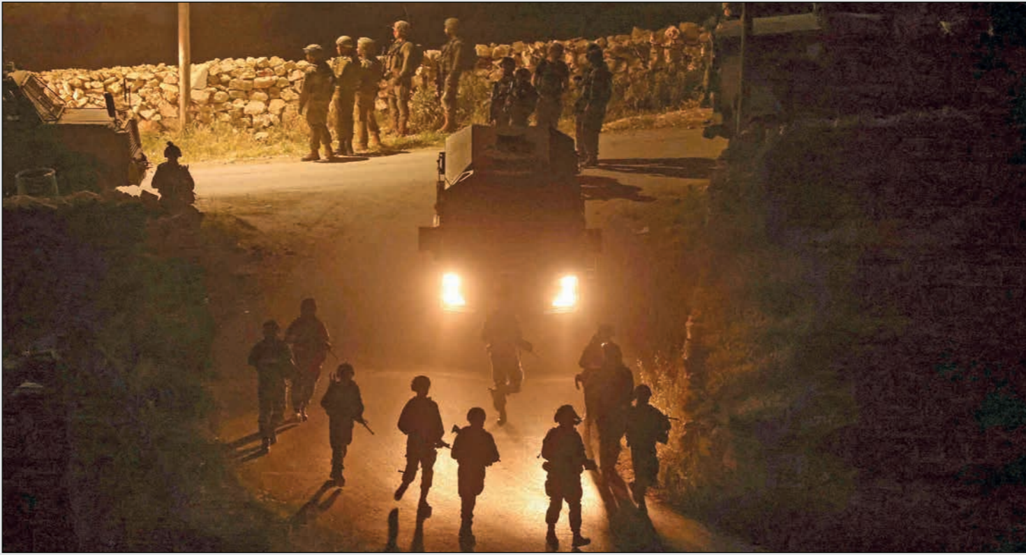
من اقتحام جيش الاحتلال لغزة بني نعيم أمس الأول