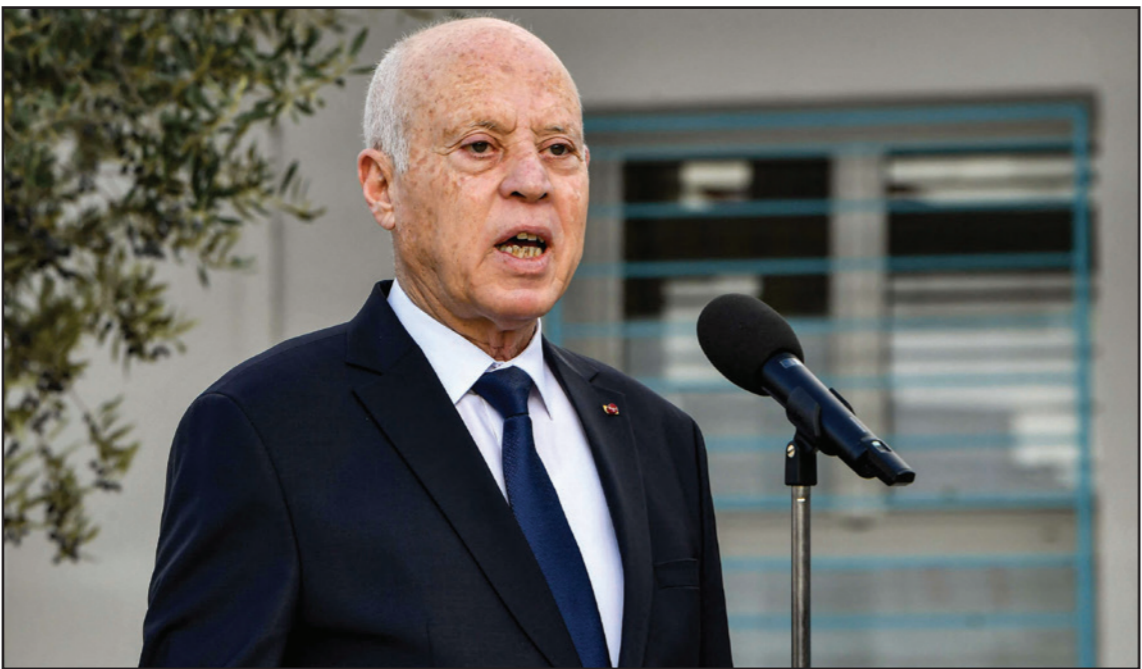
الرئيس التونسي قيس سعيد

وخاطب عدد من ضباط الأمن بقوله: «قمتم بالواجب وستواصلون العمل حتى لا يستباح وطننا من أي كان بناء على القانون وعلى قيمنا التي تفرض علينا عدم القبول بالاتجار بالبشر وبأعضاء البشر، ولن نقبل بكل اصناف الجريمة»، متابعاً «نحن من ضحايا اقتصاد عالمي غير عادل، ونرفض بكل وضوح أن نتفاقم أو ضاع شعبنا وأن نطالنا آثاره المدمرة وتبعاته الخطيرة تحت أي عنوان».