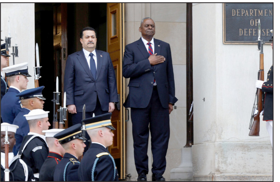
رئيس الوزراء العراقي محمد شياع السوداني خلال استقباله في البنتاغون من جانب وزير الدفاع الأمريكي لويد أوستن

وقال خلال مؤتمر صحفي عقده في السليمانية، إن «الجانب العراقي كانت لديه عقود جاهزة حول عملية تجهيز الأسلحة لطيران الجيش ومجالات الدفاع الجوية، وقد تم التوقيع من قبل الجانب الأمريكي وممثل وزارة