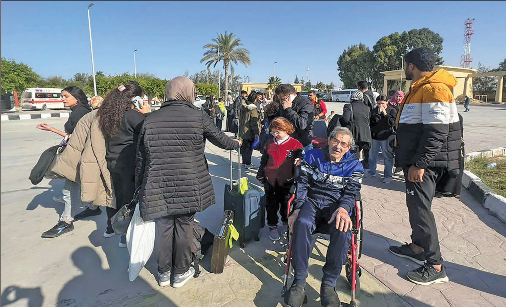
فلسطينيون يغادرون غزة جراء الحرب في انتظار دورهم عند معبر رفح