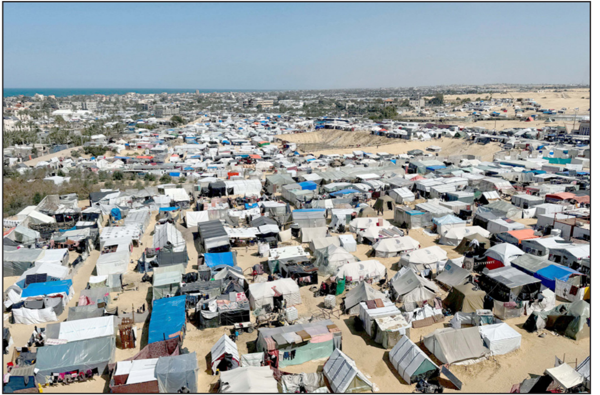
خيم على الجانب الفلسطيني من الحدود مع مصر

وإصدار الرئيس عبد الفتاح السيسي، في 29 نوفمبر/ تشرين الثاني 2014 القرار رقم 444 لسنة 2014، الذي خصص خمس كيلومترات من الأرض داخل مدينة رفح كمنطقة حدودية «محظورة» على طول الحدود مع قطاع غزة، بدعوى مواجهة تهديدات التفجير، ومن ثم، تم هدم آلاف المنازل في منطقة مأهولة، لتخصيص منطقة عازلة على الحدود مع قطاع غزة، ودمرت أحياء وأماكن الأقدنة الزراعية. وفي 23 سبتمبر/ أيلول 2021، أصدر السيسي القرار رقم 420 لسنة 2021، الذي نص على تحديد قرابة ثلاثة آلاف كيلو متر مربع من الأراضي في شمال شرق شبه جزيرة سيناء، كمناطق حدودية تخضع لقيود صارمة. وشمل القرار الكثير من القرى والتجمعات السكنية ومدنا رئيسية لا زالت تضم آلاف السكان، ضمن المناطق المحظورة. ووفقا لتقديرات نشرتها مؤسسة «سيناء لحقوق الإنسان»، فإن نحو 40 ألف مواطن في