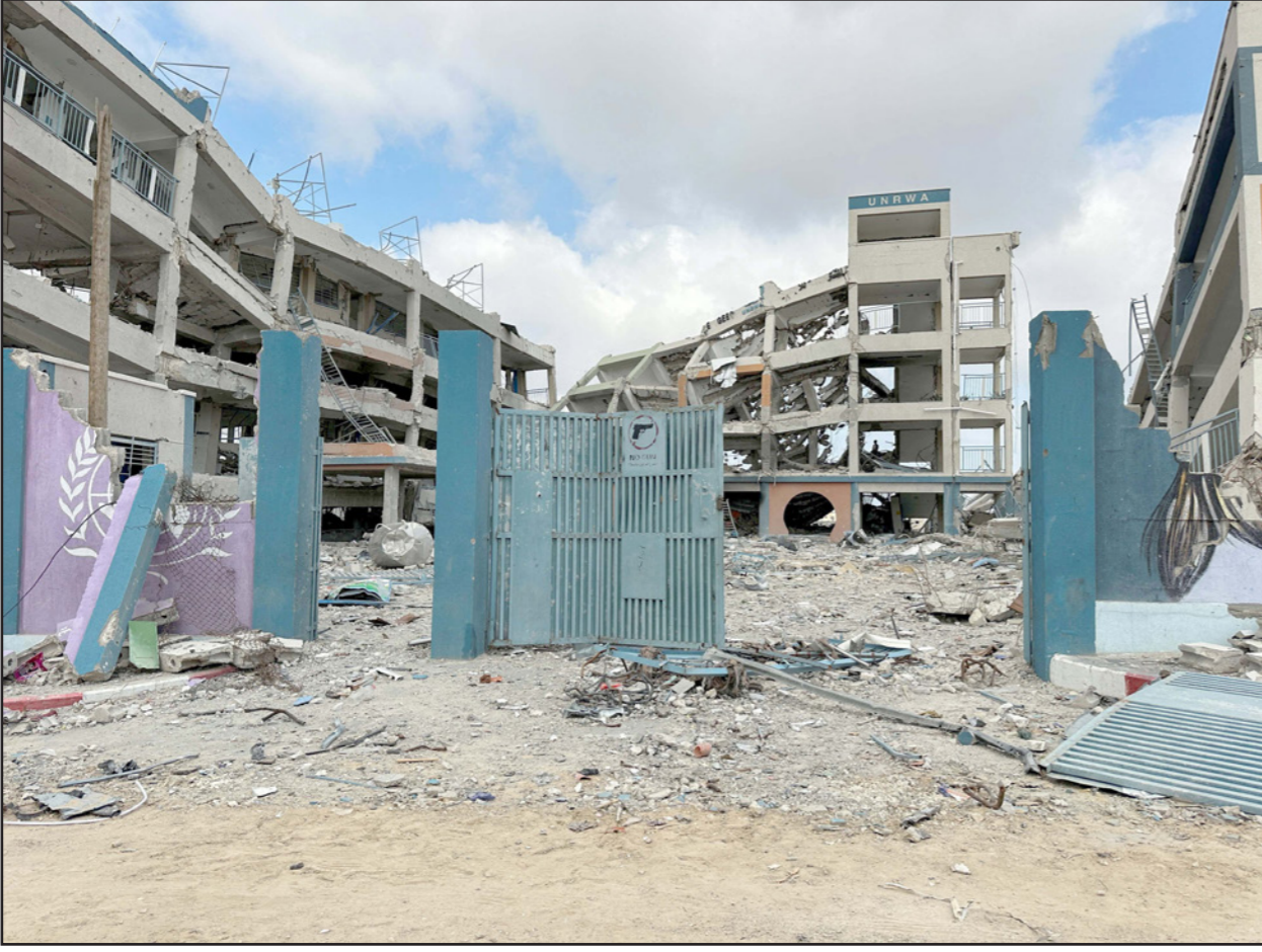
أحد مباني الأونروا المدمرة في غزة

الجمعية العامة للأمم المتحدة. كما أكد على أهمية استئناف الدول المانحة دعمها لـ «الأونروا» من أجل تمكينها من تلبية احتياجات اللاجئين التي تضاعفت في ظل استمرار الحرب على قطاع غزة. وقال إن هذا الدعم سيساعدها على تجاوز أزماتها المالية، وتقديم خدماتها الحيوية، لافتا إلى أنه يحمل رسالة قوية إلى الدول الأعضاء