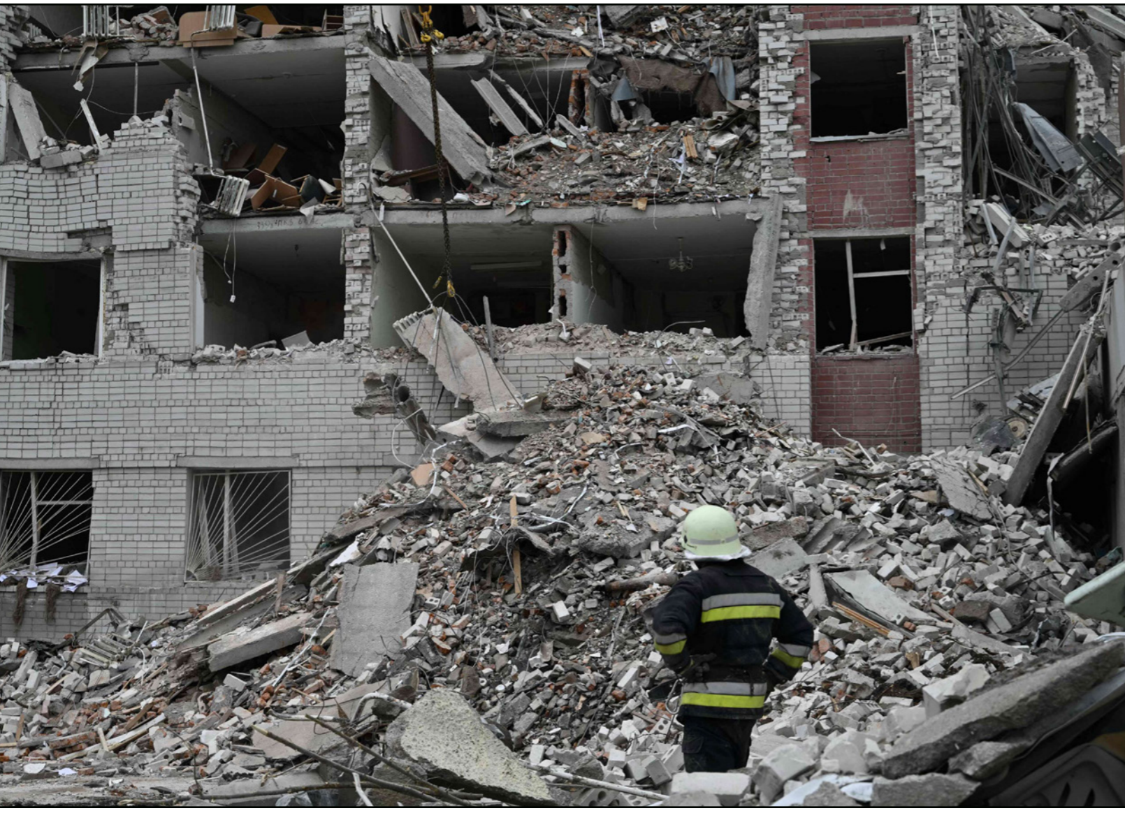
عامل إغاثة يقف أمام مبنى دمره القصف الروسي في تشرنيهيف

أكد الكرملين، أمس الخميس، أن المساعدات الأمريكية الموعودة لأوكرانيا والتي سيصوّت عليها مجلس النواب الأمريكي، السبت، بعد طول عرقلة لن تتمكّن من تغيير أي شيء على أرض الميدان، حيث يحقق الجيش الروسي تقدماً في هجومه، وتطالب كييف حلفاءها الغربيين باستمرار بدءها بالزيد من الذخائر وأنظمة الدفاع الجوي، في حين تقصف القوات الروسية يومياً المدن الأوكرانية وبنى تحتية ولا سيما منشآت الطاقة. وبيّضت مجلس النواب الأمريكي، السبت، على نص يقضي بتقديم مساعدات عسكرية واقتصادية إضافية لأوكرانيا بحوالي 61 مليار دولار، ما قد يسمح لجيشها بالتقاط أنفاسه. وتعليقاً على هذا التصويت، قال المتحدث باسم الرئاسة الروسية، ديمتري بيسكوف: «لا يمكن أن يؤثر ذلك بأي شكل على تطور الوضع على الجبهات»، وأضاف لصحافيين أن «هذا الأمر لا يمكن أن يغير شيئاً». لافتاً إلى أن «جميع الخبراء يشيرون إلى أن الوضع على الجبهة من الآن فصاعداً ليس لصالح الجانب الأوكراني». وموسكو متفائلة بعد أشهر من فشل الهجوم المضاد الذي شنّته كييف في صيف العام 2023، ومع تحقيق الجيش الروسي مكاسب ميدانية تدريجاً خصوصاً في منطقة دونباس التي تشكل هدفاً رئيسياً للمكملين. وتعاني أوكرانيا في مواجهة الجيش الروسي المتفوق على جيشها عدداً وعتاداً والذي أنهك جراء عامين من القتال. وتفتقر القوات الأوكرانية خصوصاً لأنظمة دفاع جوي لصدّ هجمات روسيا اليومية بالسيراتر المفخخة والصواريخ على غرار الضربة الصاروخية الروسية على تشرنيهيف الأربعة والتي خلّفت 18 قتيلًا. وتحدّث الرئيس الأوكراني، فولوديمير زيلينسكي، بشكل شبه يومي، عن نقص المساعدات الغربية. وفي منتصف آذار/ مارس، اعتبر زيلينسكي أن التعجيل بإقرار الكونغرس الأمريكي لمشروع القانون المتعلق بتخصيص حزم مساعدات