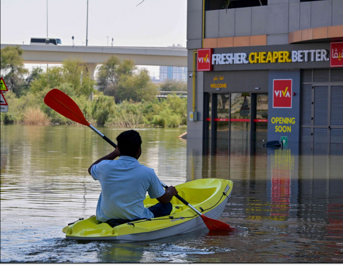
رجل يقود زورقاً في شارع غمور بالمياه في دبي