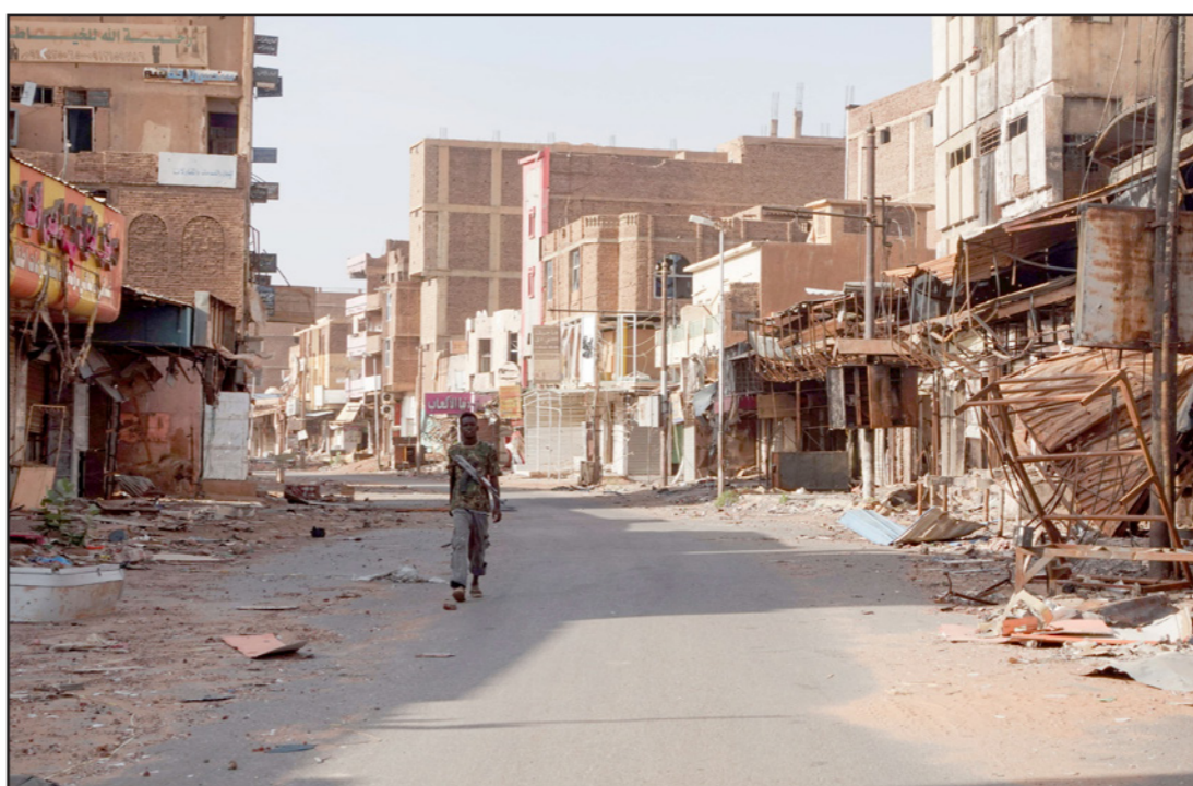
مسلح سوداني يمشي وسط آثار المعارك في أمدرمان

أعداد كبيرة من المدنيين من المدن إلى القرى بسبب تصاعد المعارك.