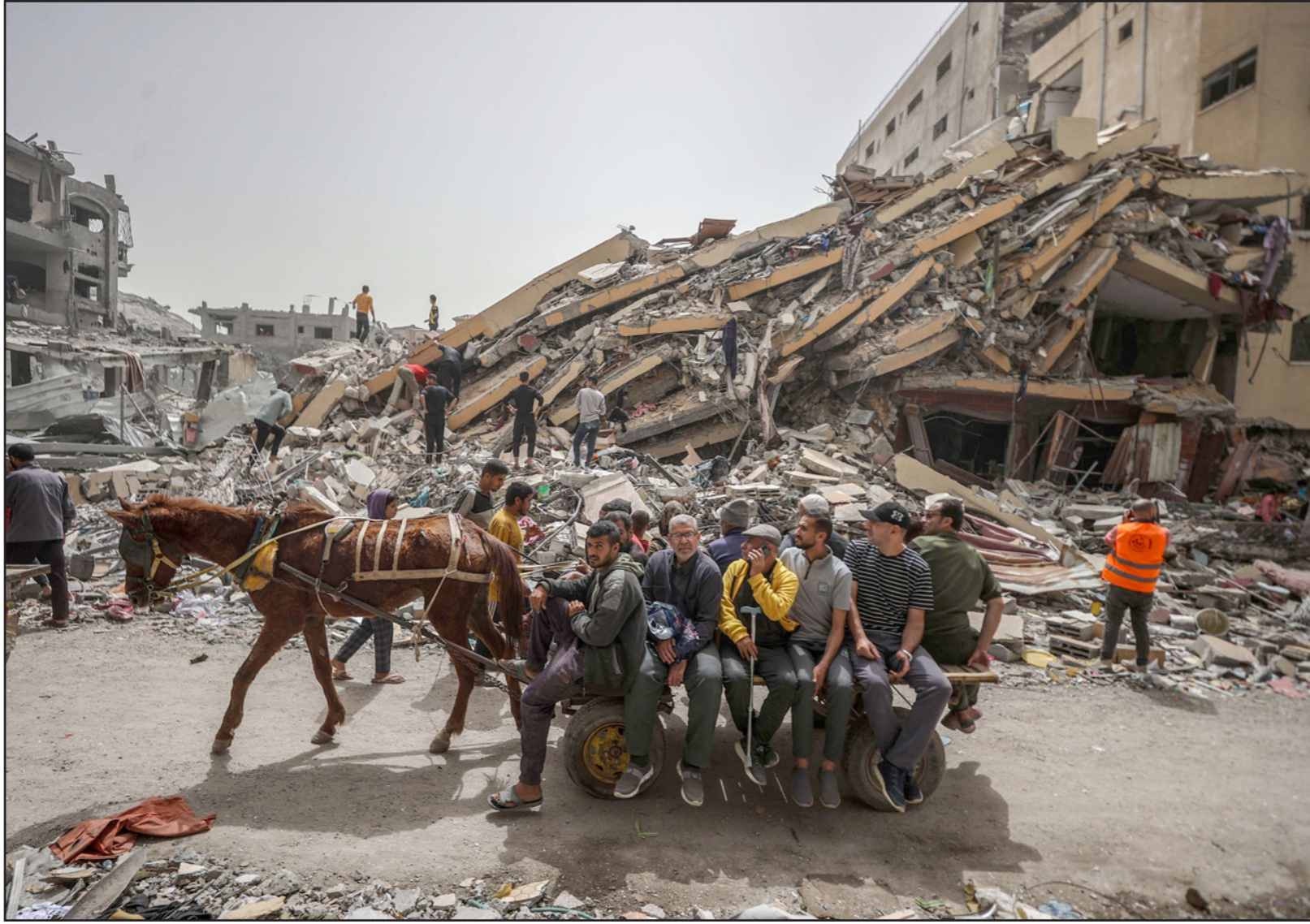
نازحون فلسطينيون في غزة

سند؟ أين العرب؟» وأظهر تحليل بيانات لصور التقطتها الأقمار الصناعية، حجم الدمار الذي لحق بالمباني في قطاع غزة، إذ تضرر أو دمر ما بين 144 ألف مبنى و175 ألفاً في القطاع بفعل الغارات التي تشنها الطائرات الحربية الإسرائيلية، وهذا ما يعادل بين 50% و61% من مباني غزة. قارن التحليل، الذي أجراه كوري شير من مركز الدراسات العليا في جامعة سبتي في مدينة نيويورك، وجامون فان دهوك من جامعة ولاية أوريغون، بين صور التقطت بواسطة الأقمار الصناعية للمباني في غزة قبل وبعد الحرب، للكشف عن التغييرات المألوفة في ارتفاع المباني أو هيكليها، والتي تبين حدوث تدمير.